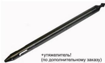
+утяжелитель! (по дополнительному заказу)