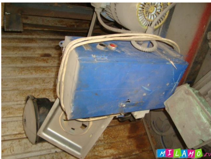
Фото и стоимость по запросу