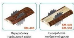
Переработка горбыльной доски (KM-400) / Переработка необрезной доски (KM-350)